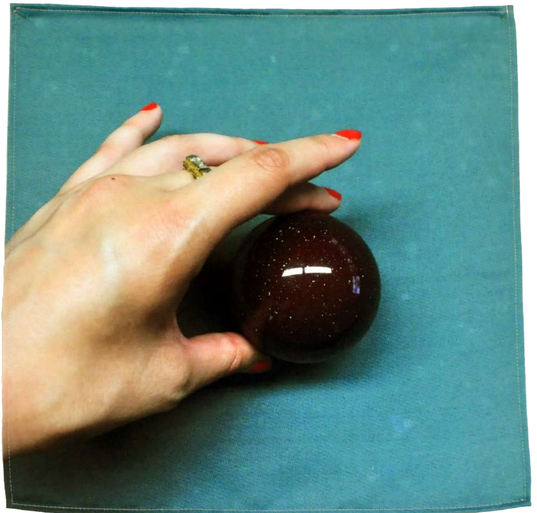
Les règles du jeu, 2019 Photographie imprimée sur textile, 40/40cm

Cette pièce a été exposée à l'Institut Français d'Autriche.