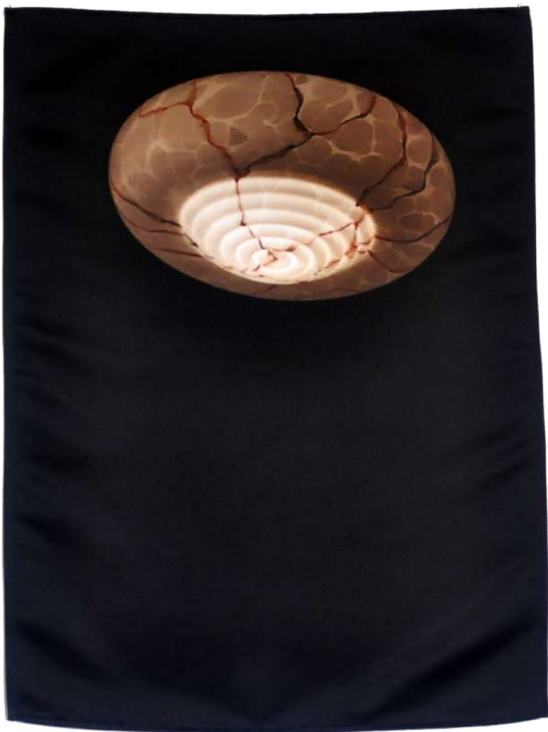
Freundgasse , 2019, Photographie imprimée sur textile, 60/45 cm