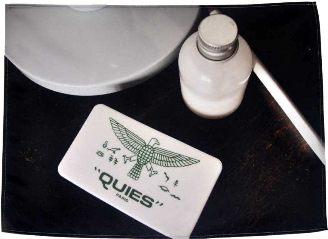
Qui est-ce ?, 2019, Photographie imprimée sur textile, 60/45 cm