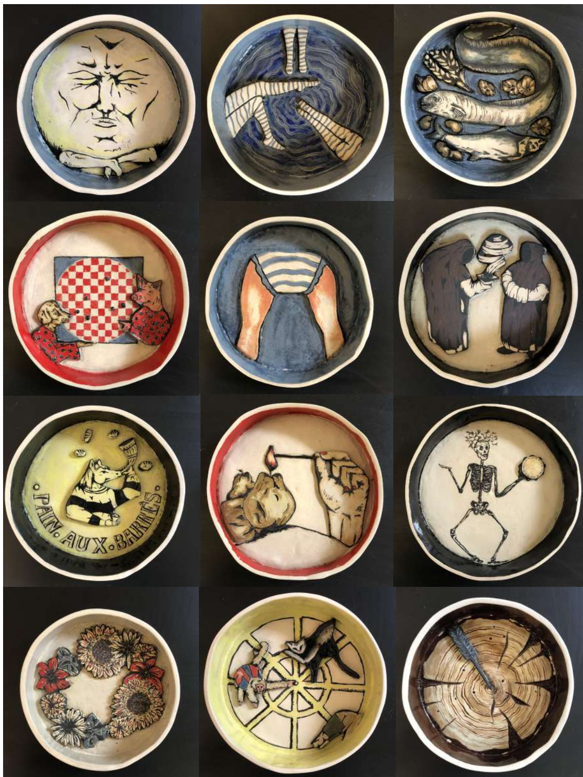
les 12 compositions en céramiques ( 20 cm de diamètre)

J'ai réécrit ce fabliau en une version plus contemporaine. À partir de ce texte, j'ai réalisé un ensemble de 12 céramiques et dessins préparatoires tels des petites scénettes qui donneront naissance à d'autres pièces plus performatives sur ce sujet des crieries.