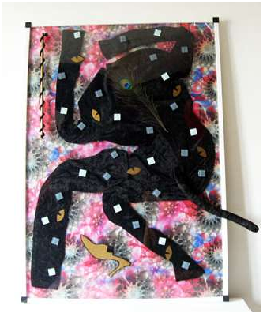
Détail de l'installation

De 'l'Olympia' de Manet et son chat noir, en passant par celle de Hoffmann aux yeux de verres, quelles sont nos projections sur ces corps de femmes-objets ? Comment les objets nous perçoivent-ils ? Qui parle à la place des femmes ? Cette video installation est construite autour d'un poème à 5 strophes qui donne la voix à 5 femmes, nous portant à la méditation.