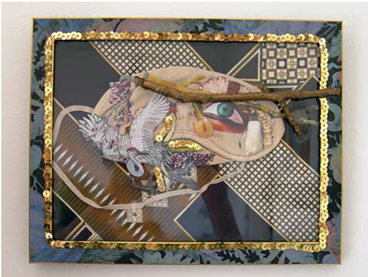
Détails de l'installation