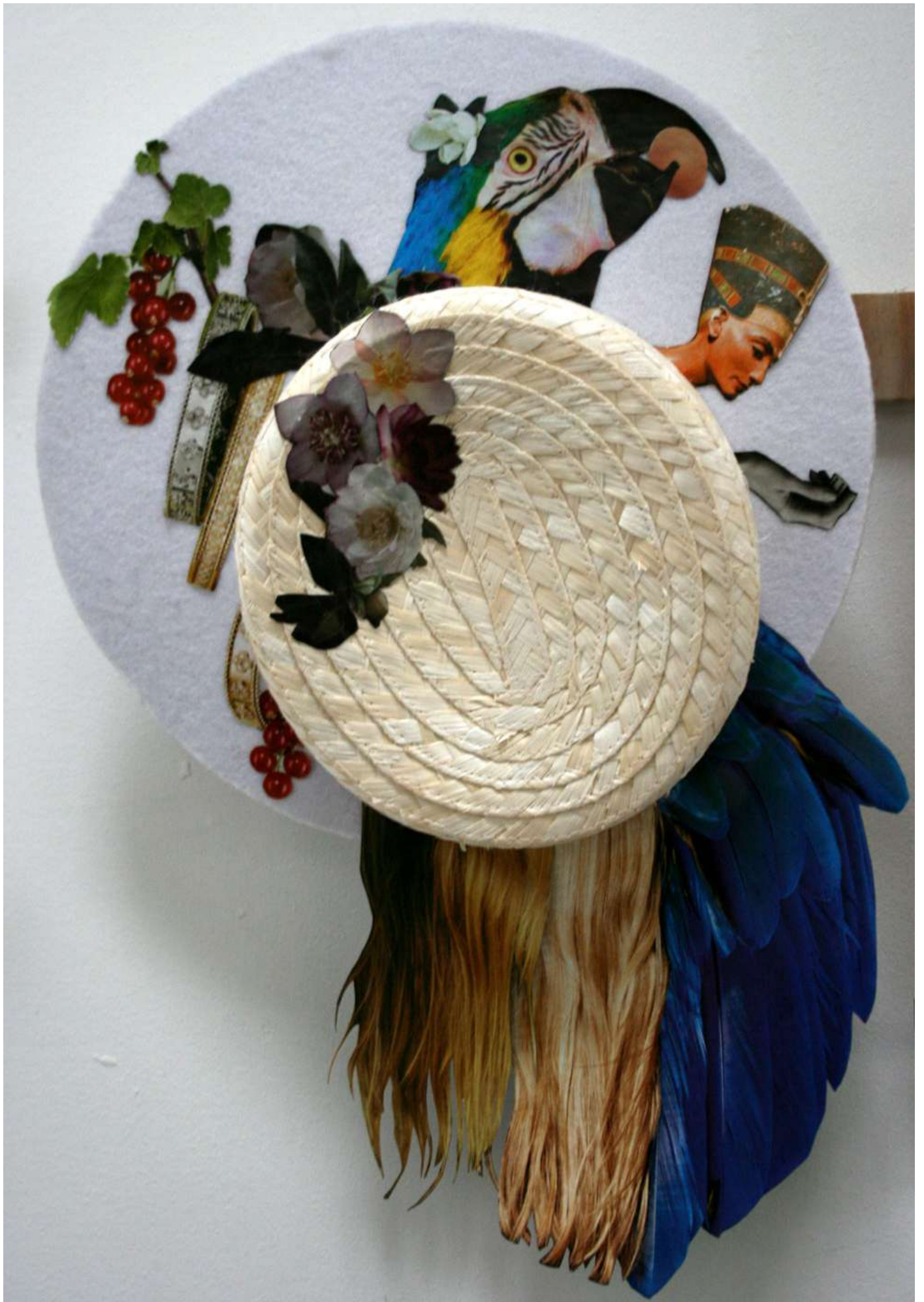
Détail de l'installation