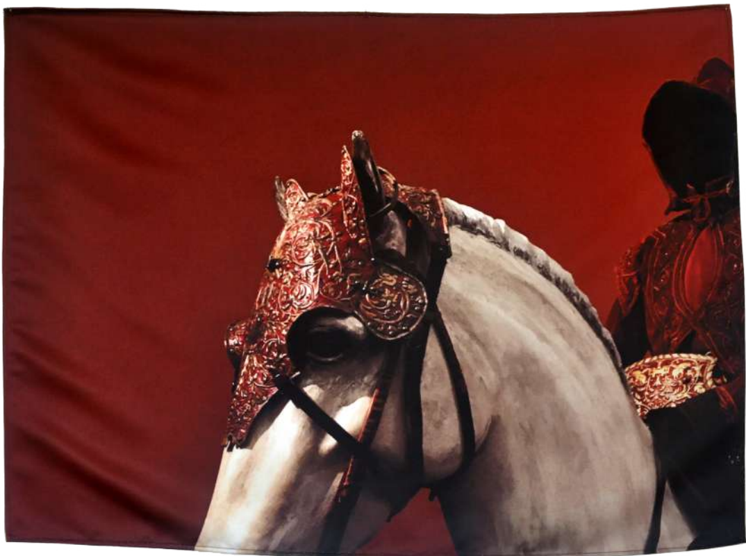
La langue pour parler aux chevaux, 2019, Photographie imprimée sur textile, 80/60 cm