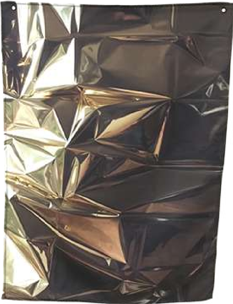
Survie , 2020, Photographie imprimée sur textile, 60/45 cm