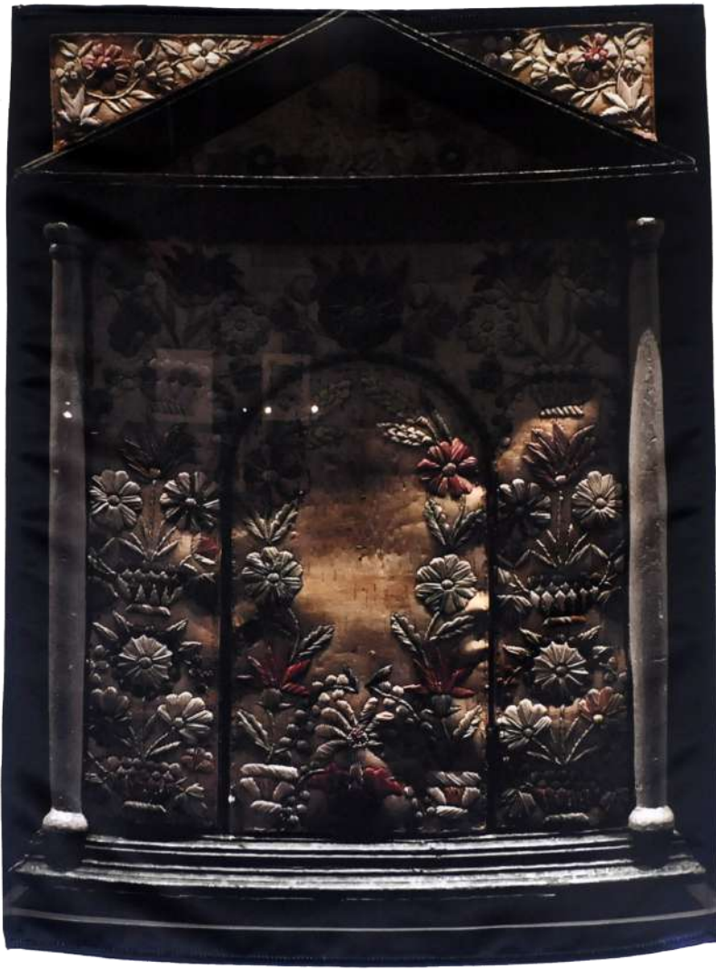
Tabernacle , 2019, Photographie imprimée sur textile, 60/45 cm