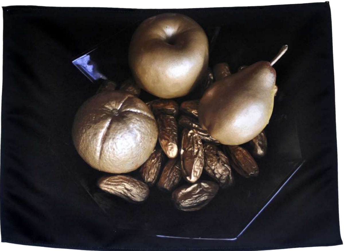
Still Life /Europa , 2019 Photographie imprimée sur textile, 60/45 cm.