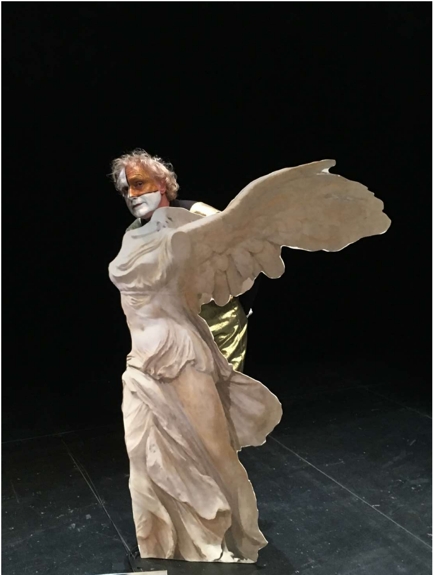
Répétitions de Mythologies de la dette , au TNB, Rennes, le 7 nov. 2018