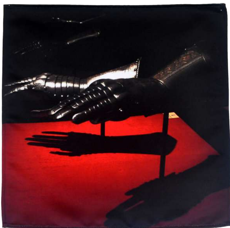
Leopold , 2019, Photographie imprimée sur textile, 40/40cm