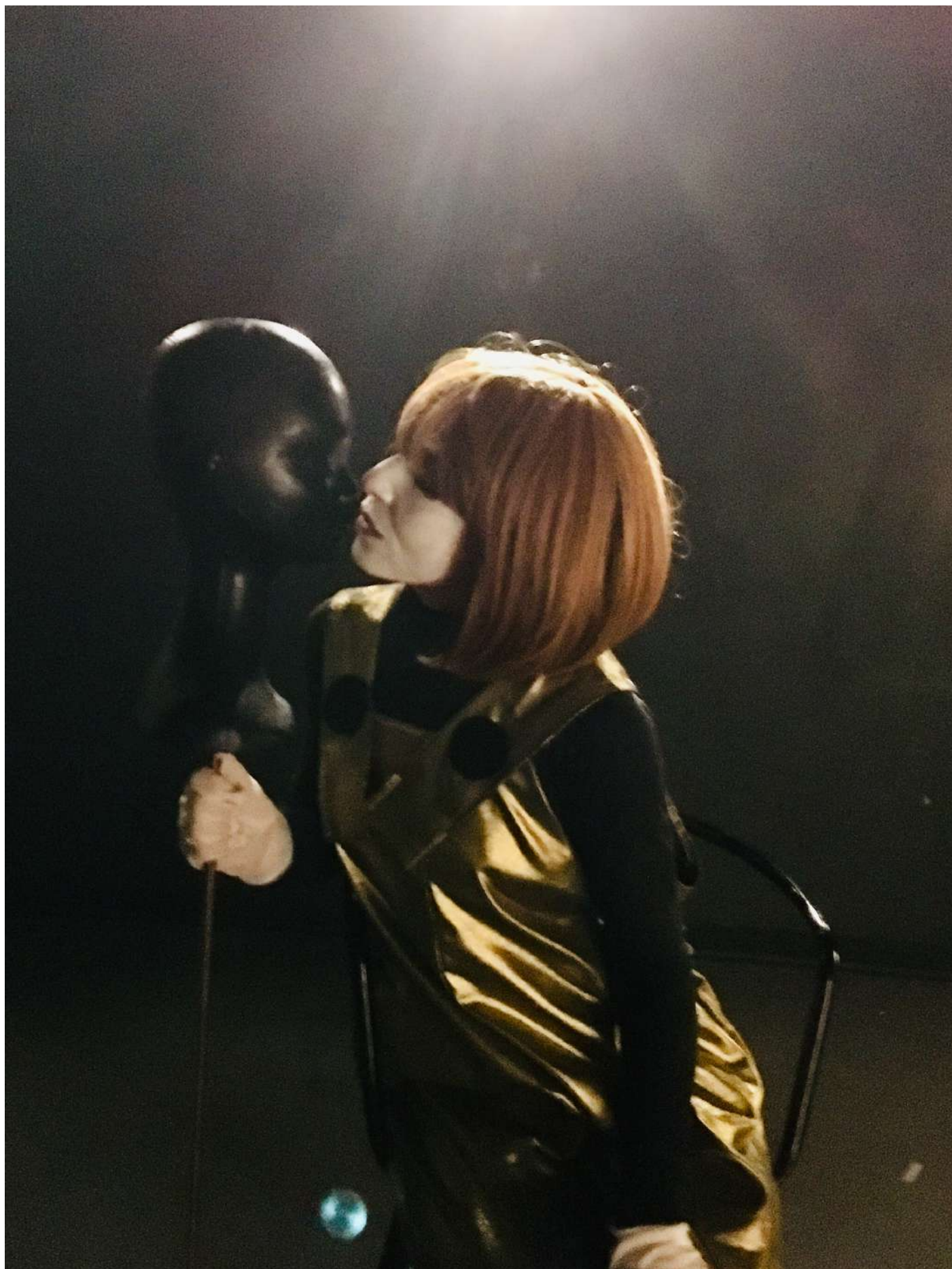
Répétitions de Mythologies de la dette , au Silencio, Paris, le 20 fév.2019