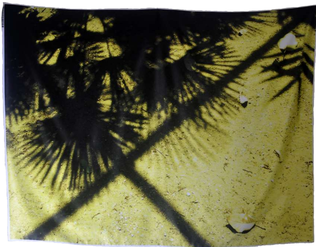
Hier, 2019, Photographie imprimée sur textile, 120/160 cm