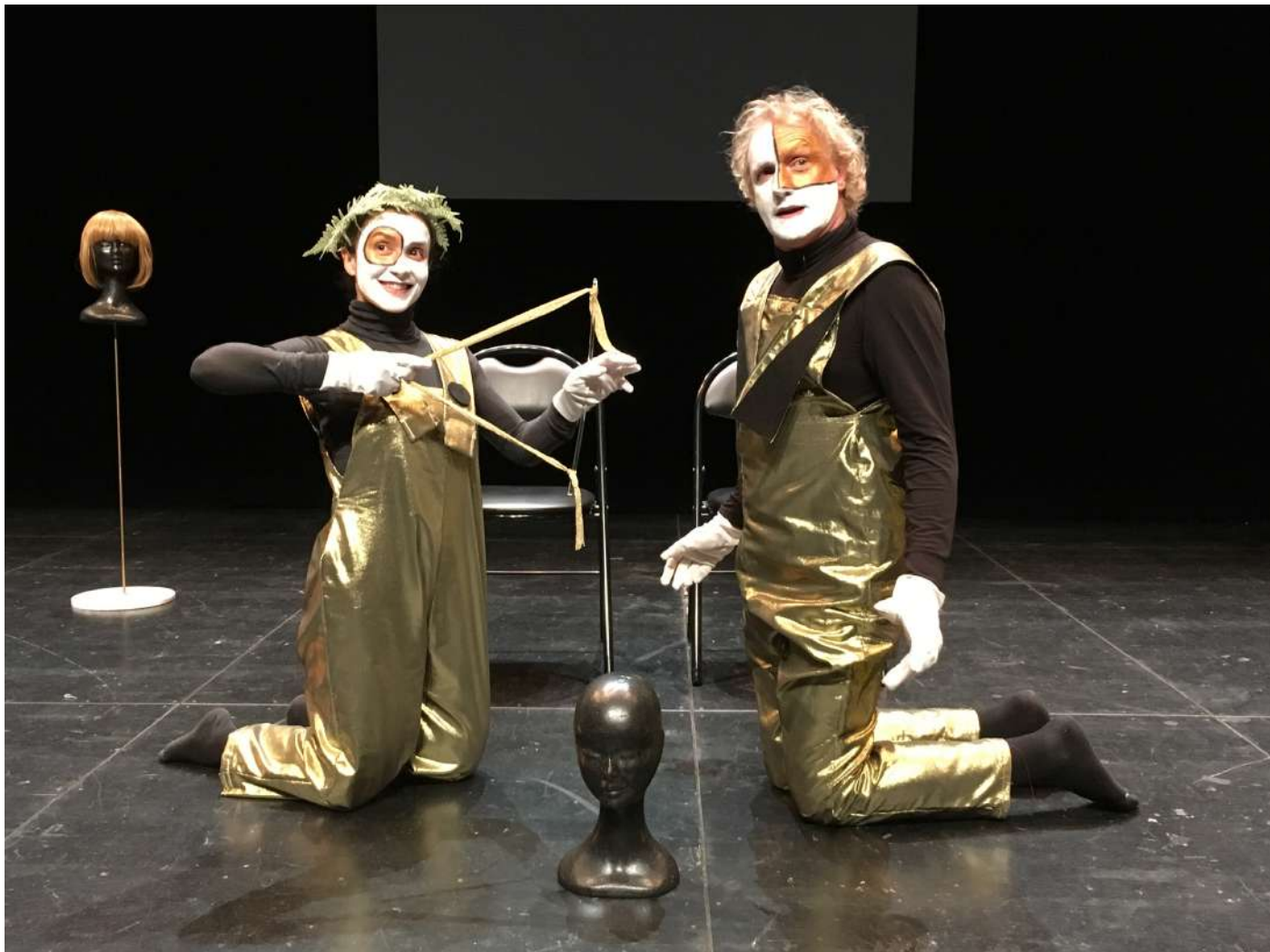
Répétitions de Mythologies de la dette , au TNB, Rennes, le 7 nov.2018