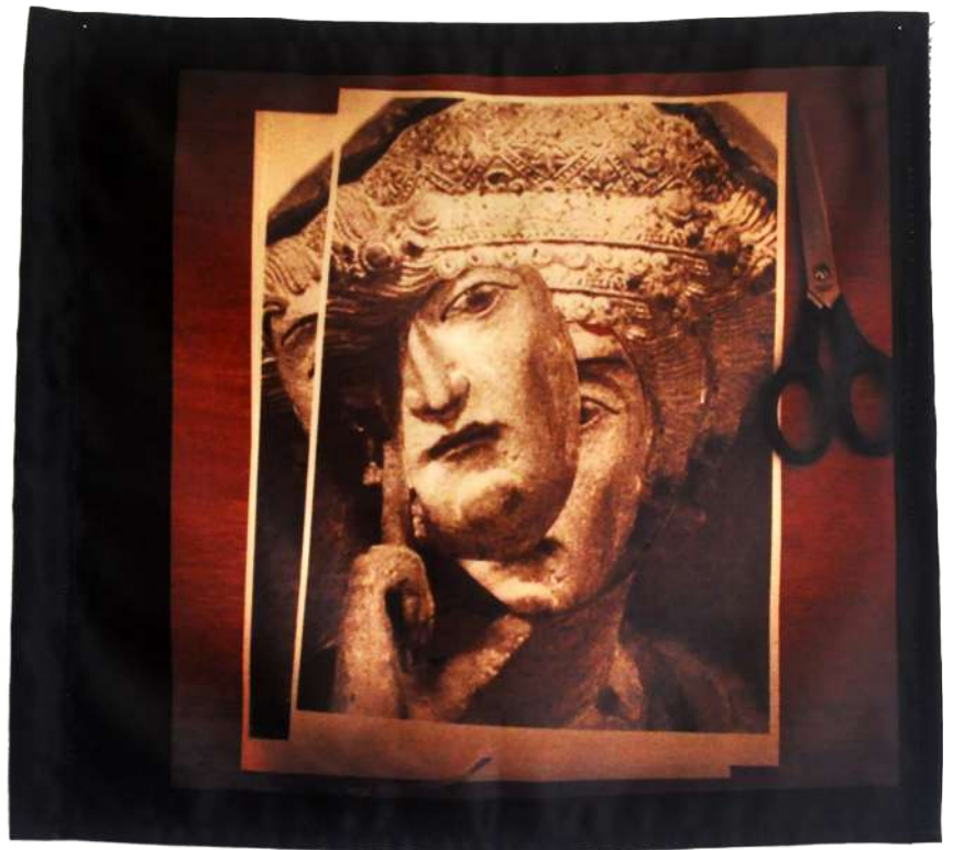
Zenobie , 2019 Photographie imprimée sur textile, 40/40cm