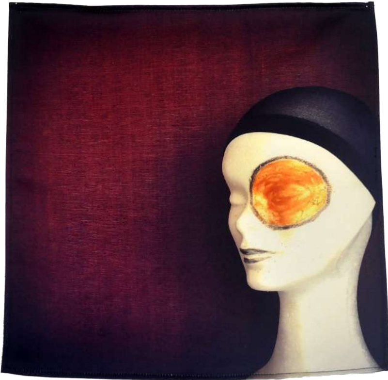
Dieu cercle , 2019 Photographie imprimée sur textile, 40/40cm