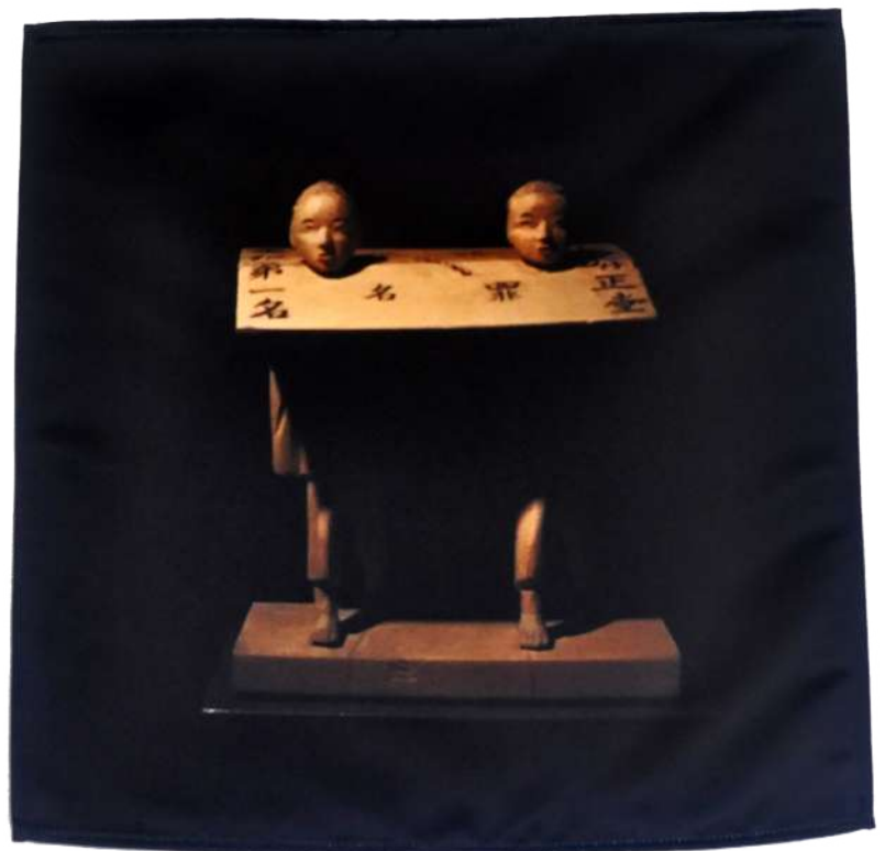
Souvenir , 2019, Photographie imprimée sur textile, 40/40cm