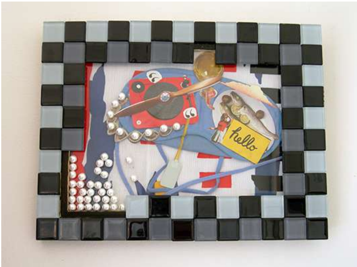
Détails de l'installation