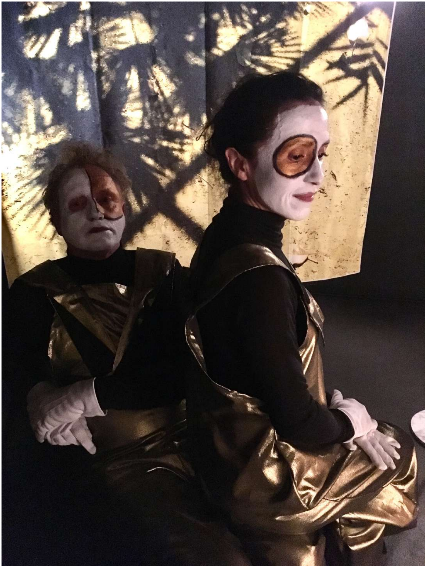
Répétitions de Mythologies de la dette , au Silencio, Paris, le 20 fév.2018