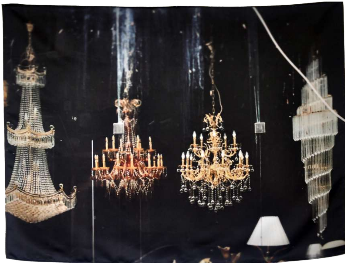
Tel-Aviv, 2019, Photographie imprimée sur textile, 105/80 cm