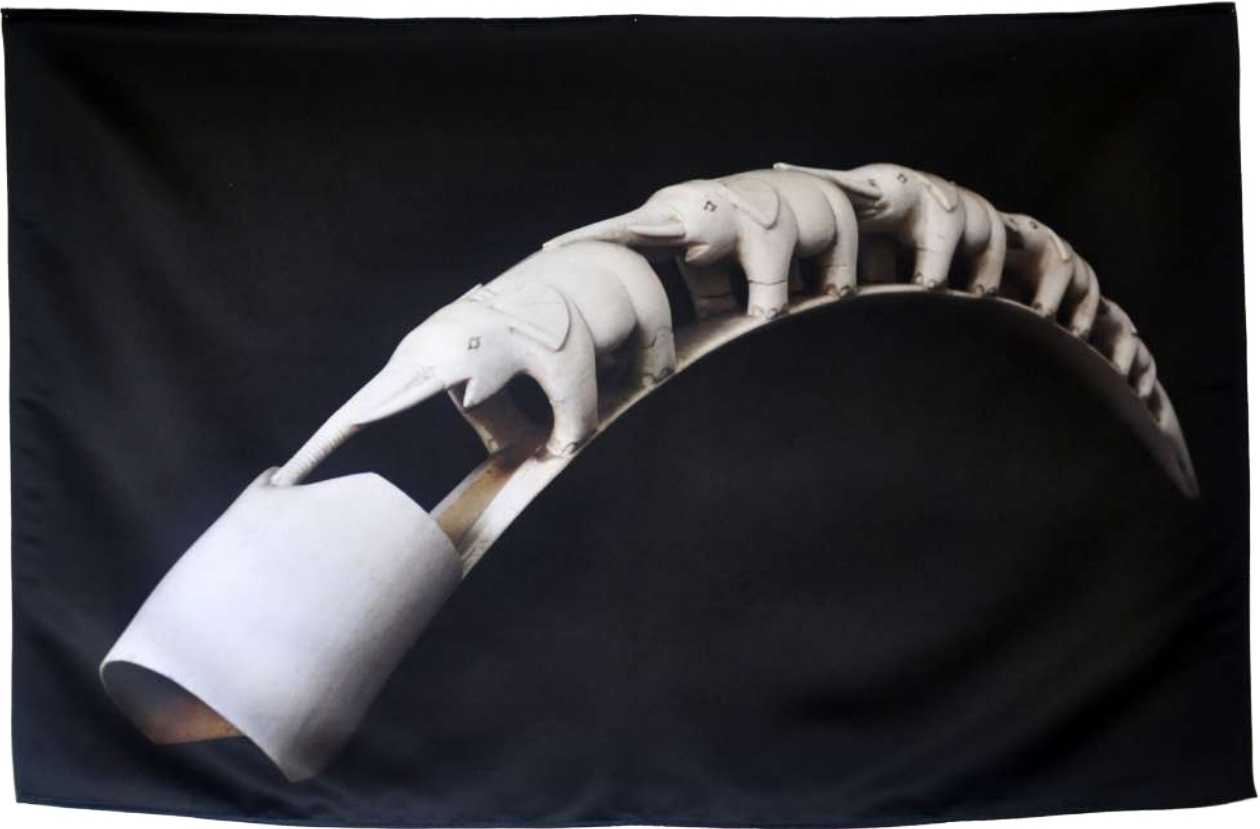
Marseilles , 2019, Photographie imprimée sur textile, 105/70 cm.