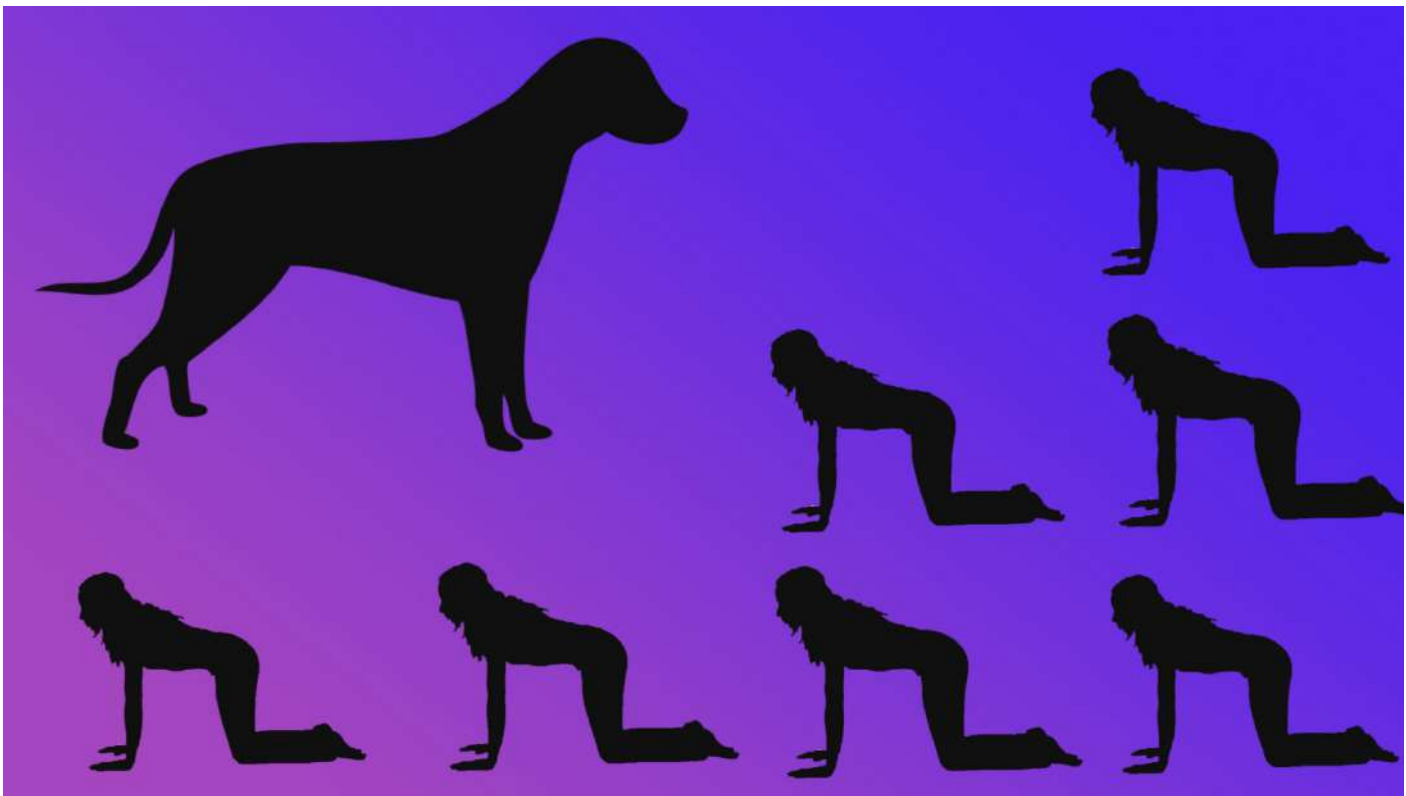
Capture d'écran de la vidéo Why Dogs Can't Speak