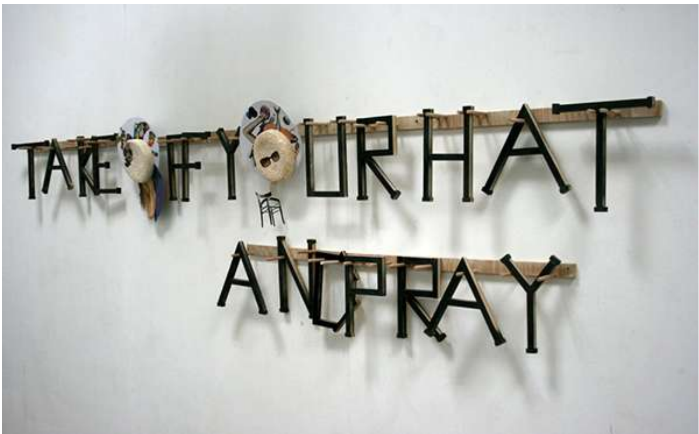
Détails de l'installation