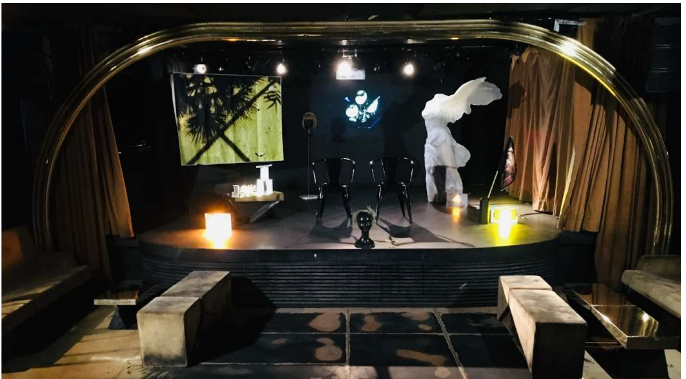
Scénographie au Silencio, Paris, le 20 fév.2019

Dans une Olympe contemporaine, deux Dieux de la Dette explorent inlassablement les archives des sorts qu'ils ont eux-même jetés aux humains en 2016. Ces deux diabolotins ont ré-enregistrés ces témoignages audio et s'amuse sans fin à les singer. Leur jeu s'articule autour d'un écran/oracle qui énonce le nom et l'âge du témoignage à rejouer. Ils rivalisent alors d'inventivité autour de ces textes qu'ils connaissent par coeur ; l'un devenant alternativement ventriloque ou pantin du second. Au fur et à mesure des interprétations, leur jeu moqueur de ces humains s'émancipe, malgré eux, du sarcasme et s'ouvre finalement vers l'empathie et l'espoir envers les futures générations. Les enregistrements et le playback disparaissent peu à peu, laissant la place à une interprétation affectée, à voix haute.